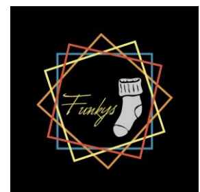
Abbildung 2/ Logo; Funkys

Wir haben den Firmennamen Funkys ausgewählt, weil wir sehr farbenfrohe und spezielle Socken machen wollen die von den üblichen schwarzen und weissen Socken herausstechen sollen. Unser Logo besteht aus 3 verschiedenen Komponenten. Die erste Komponente sind die vier farbigen Quadrate. Sie stehen dafür, dass unser Produkt farbig ist. Die zweite Komponente ist der Firmenname Funkys und der letzte ist der Socken, dieser repräsentiert unser Produkt.